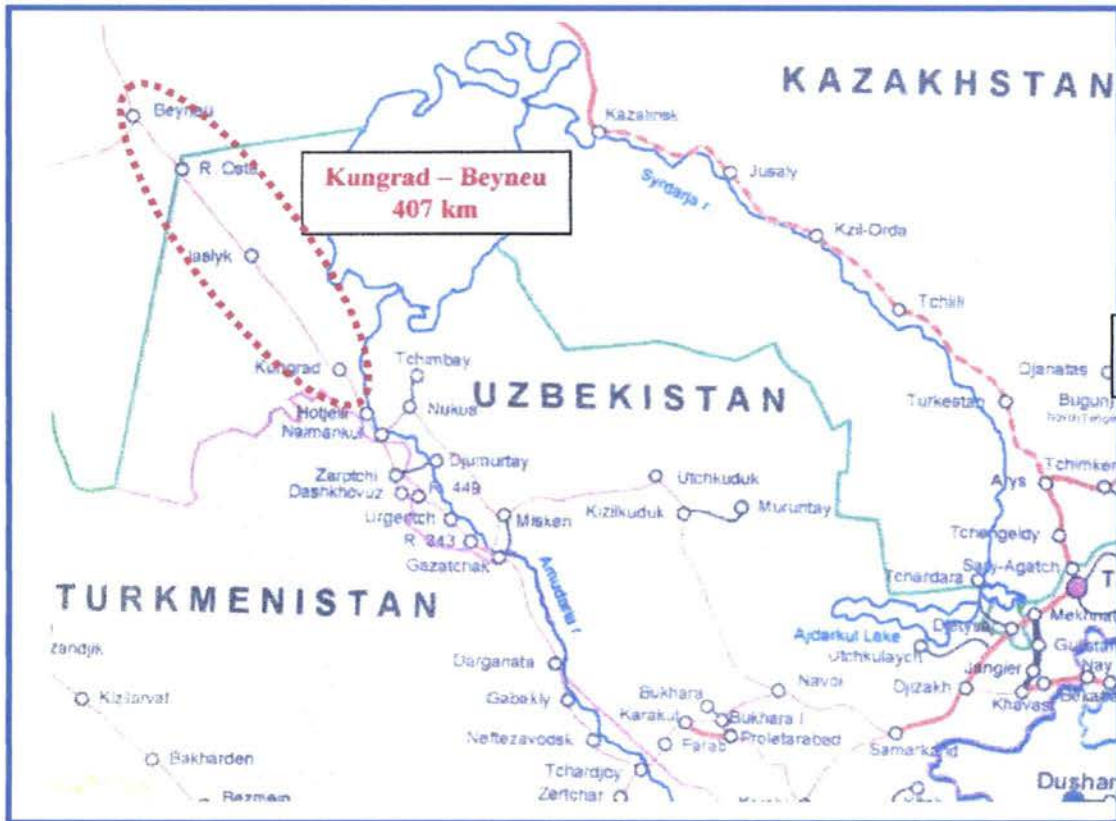
Рисунок 1 – 1- Железнодорожная линия Кунград – Бейнеу

Детально линия показана на следующем Рисунке 1–2.